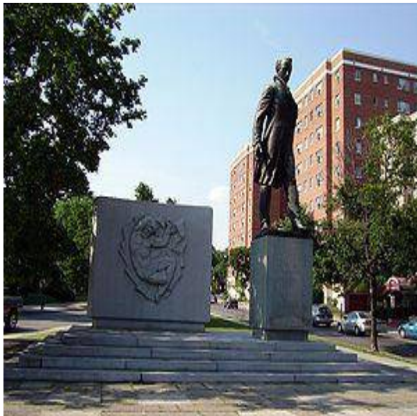
Італійський скульптор Уго Мацеї одягнув Тараса Григоровича в римську тогу, зобрази-

Пам'ятник у Вашингтоні встановлено силами українських емігрантів. Але до його відкриття причетні 5 американських президентів. Г. Трумен був почесним головою комітету по створенню пам'ятника. До складу комітету входив майбутній президент Р. Рейган. Президент Д. Ейзенхауер підписав закон про будівництво пам'ятника. Д. Кеннеді допоміг реалізувати задум, а спеціальна заява Л. Джонсона вмурована під постаментом. Цікава деталь: при закладанні пам'ятника використовувалася спеціальна лопата, яку до того використовували при закладанні пам'ятників Д. Вашингтону й А. Лінкольну. Скульптор Леонід Молодожанін (Лео Мол) та архітектор Радослав Жук створили чи не найцікавіший образ поета, відійшовши від стереотипу "селянського революціонера-демократа" до "національного інтелігента-романтика".