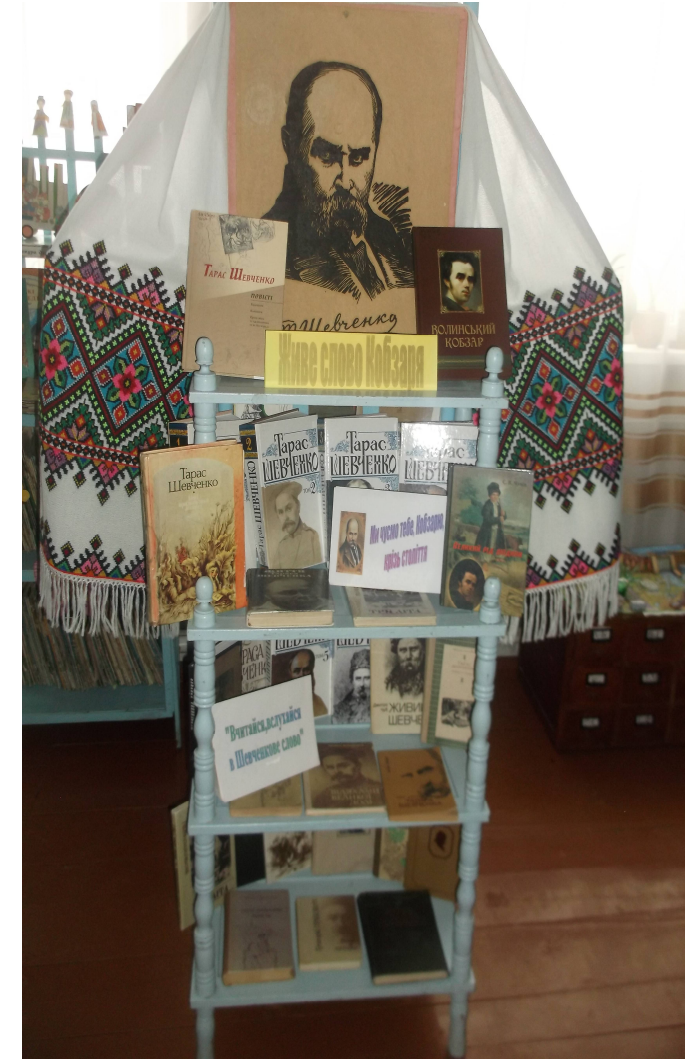
ПШБ с.Голубне 2016