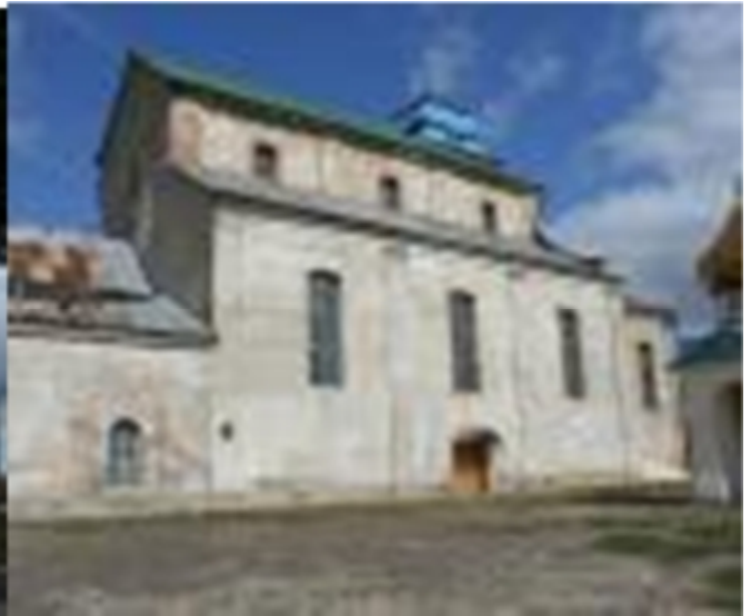
Рис. 11.1. Луцька брама Рис. 12.1. Монастир бернардинів