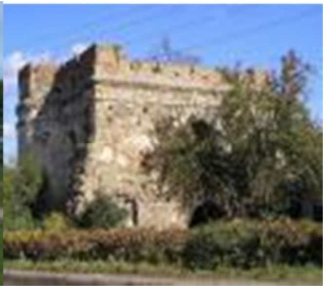
Рис. 5.1. Кругла вежа Рис. 6.1. Татарська вежа