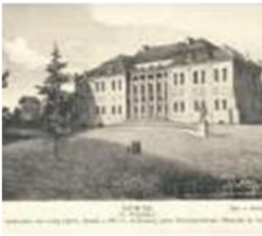
Рис. 15.1. Палац Любомирських