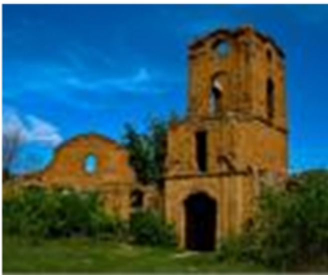
Рис. 1.1. Руїни Корецького замку