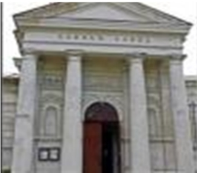
Рис. 7.1. Успенський костел