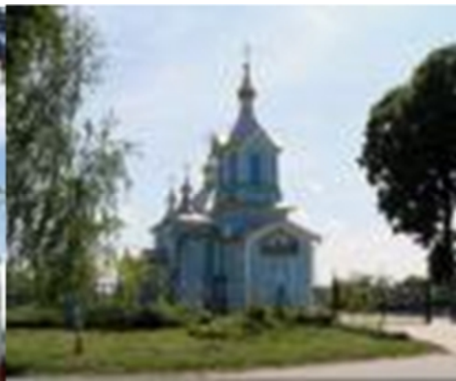
Рис. 4.1. Церква Кузьми і Дем'яна