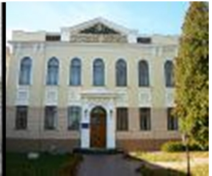
Рис. 8.1. Острозька академія