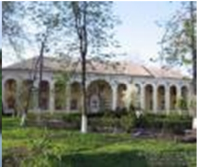
Рис. 9.1. Палац князів Любомирських Рис. 10.1. приміщення колишнього монастиря кармеліток