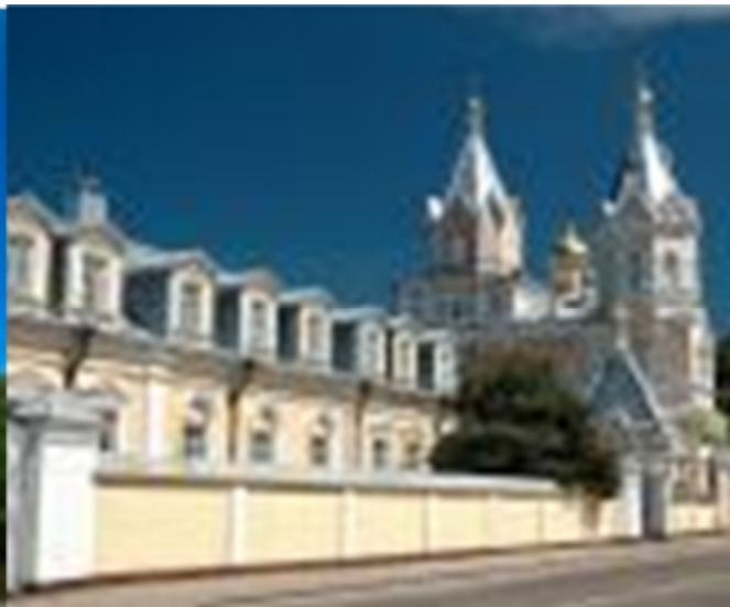
Рис. 2.1. Свято-Троїцький монастир