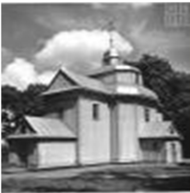
Рис. 13.1. Успенська церква