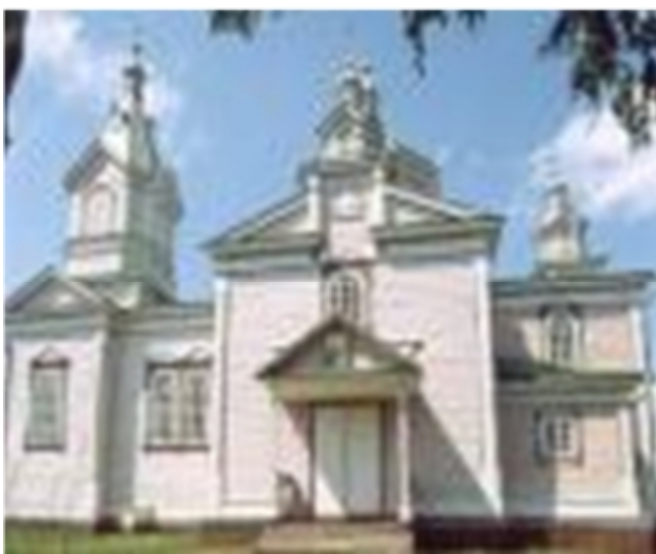
Рис. 3.1. Костел св. Антонія