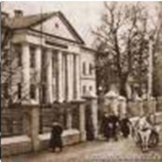
Рис. 14.1. Будинок гімназії (нині - краєзнавчий музей)